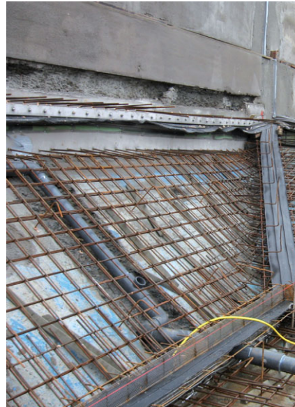
Bild 11. Sonderfall: Innenliegendes Klemmfugenband aus Nitrilkautschuk als Arbeitsfuge

Für die Fugenbandklemmkonstruktionen gelten keine einheitlichen Regelungen, die Verfahrensweisen werden allgemein als anerkannte Regel der Technik angesehen. Dies trifft jedoch nicht zu, da wie beschrieben keine allgemein gültigen Konstruktionsregeln vorliegen. Somit handelt es sich um eine nicht geregelte Bauweise. Die Verwendung dieser Konstruktionen ist mit dem Auftraggeber einvernehmlich abzustimmen und die von den geltenden Normen abweichende Bauweise ist mit diesem zu vereinbaren. Üblicherweise sollte eine Fugenbandklemmkonstruktion mit bauaufsichtlichem Prüfzeugnis verwendet werden. Die Fa. adicon GmbH hat im September 2010 bei der MFPA Gesellschaft für Materialforschung und Prüfungsanstalt für das Bau-