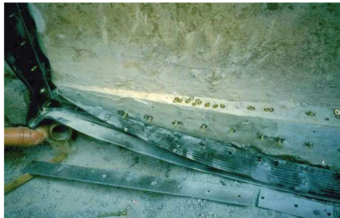
Bild 9. Innenliegendes Klemmfugenband, Setzen der Ankerstäbe

Die vorhandene Betonoberfläche des Klemmbereichs ist zu säubern und ggf. auszubessern. Eine Überprüfung auf Fehlstellen (wie z. B. Kiesnester und Risse) ist unerlässlich. Fehlstellen sind gegebenenfalls mit Epoxidharz zu schließen. Die Betonoberfläche muss glatt und eben sein. Es ist zu überprüfen, ob eine Oberflächenvergütung mit Epoxidharz erforderlich ist. Mit