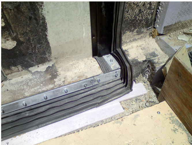
Bild 8. Außenseitiges Klemmfugenband aus Nitrilkautschuk

In der Planungsphase sind nachfolgende Rahmenbedingungen abzurufen bzw. festzulegen: