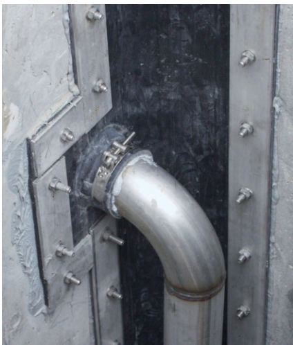
Bild 5. Außenseitiges Klemmfugenband aus Nitrilkautschuk mit Formteilanschluss und Edelstahlklemmung

Wasser beispielsweise sind Klemmschienen in der Dimension 150 mm × 10 mm, Festflansche mit Bolzen M20 jeweils in korrosionsgeschützter Ausführung vorgesehen. Bei einer Richtungsänderung des Fugenbandes von horizontal in vertikal ist der Eckbereich mit entsprechendem Radius auszurunden. Diese komplizierten und kostenintensiven Fugenkonstruktionen werden bei üblichen WU-Konstruktionen aus Beton nicht eingesetzt.