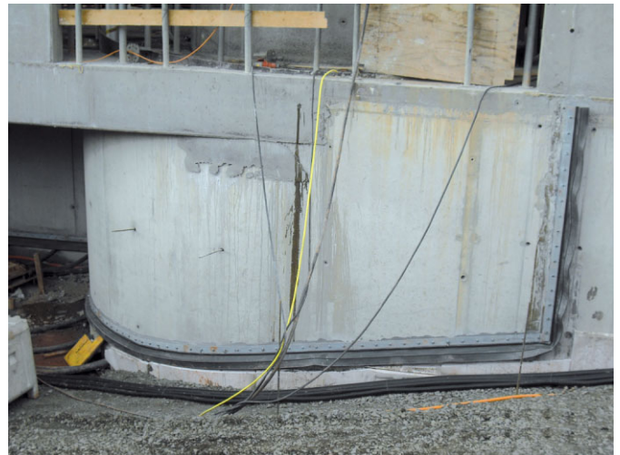
Bild 7. Innenliegendes Klemmfugenband aus Nitrilkautschuk, Montage mit Polymerquellpaste

tion des Fugenbandsystems nach Plan, ist nur in den seltensten Fällen möglich, da sich erst nach Freilegung des Bauteilanschlussbereiches die tatsächliche Fugenbandgeometrie zeigt, u. U. sind Betonschneidarbeiten zur Erzielung einer Konstruktionsfläche erforderlich.