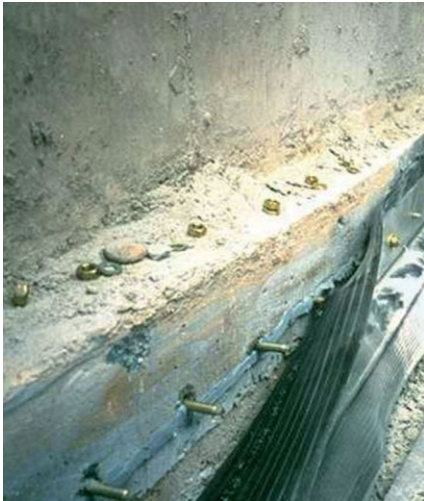
Bild 10. Innenliegendes Klemmfugenband aus Nitrilkautschuk, Montage mit Polymerquellpaste

Die Montagetechniken ähneln denen der einseitigen Fugenbandklemmkonstruktion. Sofern die doppelseitige Klemmung zugänglich ist, ist diese vor mechanischer Beanspruchung mittels Schutzblech oder konstruktiven Maßnahmen bei Anordnung in einem Fugenkanal mit einer Schleppblechabdeckung zu schützen.