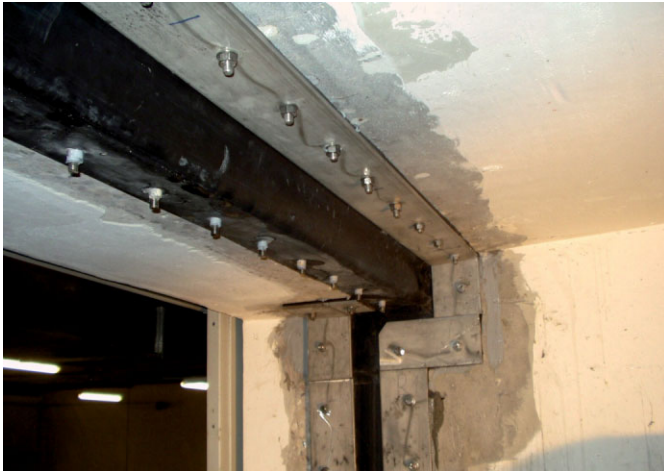
Bild 4. Doppelseitige Fugenband-Klemmkonstruktion aus Elastomer mit Edelstahlklemmung