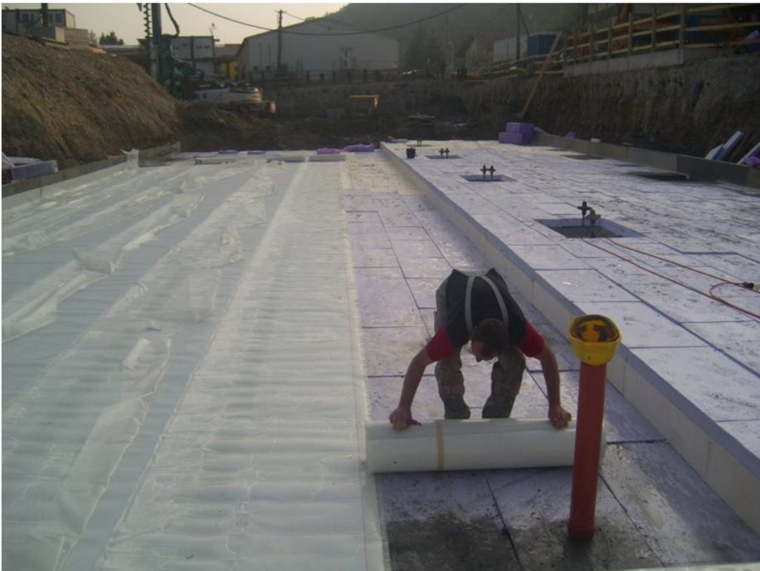
Foto 3: Verlegung von adicon® AVS Abdichtungsverbundbahn auf Wärmedämmung unter der WU-Bodenplatte

Unter Einbezug der AVS-Technik wird die Kunststoffbahn direkt auf die Dämmung verlegt. Somit entspricht die dauerhafte Dichtigkeit in Verbindung mit der Wärmedämmung der Sicherstellung der Nutzungsanforderung A* bis A***.