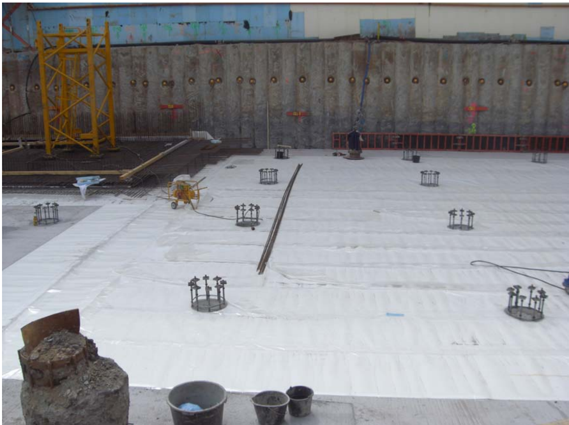
Foto 2: adicon® AVS System auf Sauberkeitsschicht (Frankfurt Städel)

Die technische Notwendigkeit als Sekundärabdichtung zur WU-Konstruktion findet in vielen hochwertig genutzten Gebäuden ihren Anwendungsbereich. Zum Beispiel: Erweiterung des Städel Museums in Frankfurt ca. 6.000 m 2 , Meritus Hotel in Frankfurt 4.000 m 2 , Forschungs- und Entwicklungszentrum Fronius in Linz, Österreich 4.000 m 2 sowie eine Vielzahl hochwertig genutzter Neubauten.