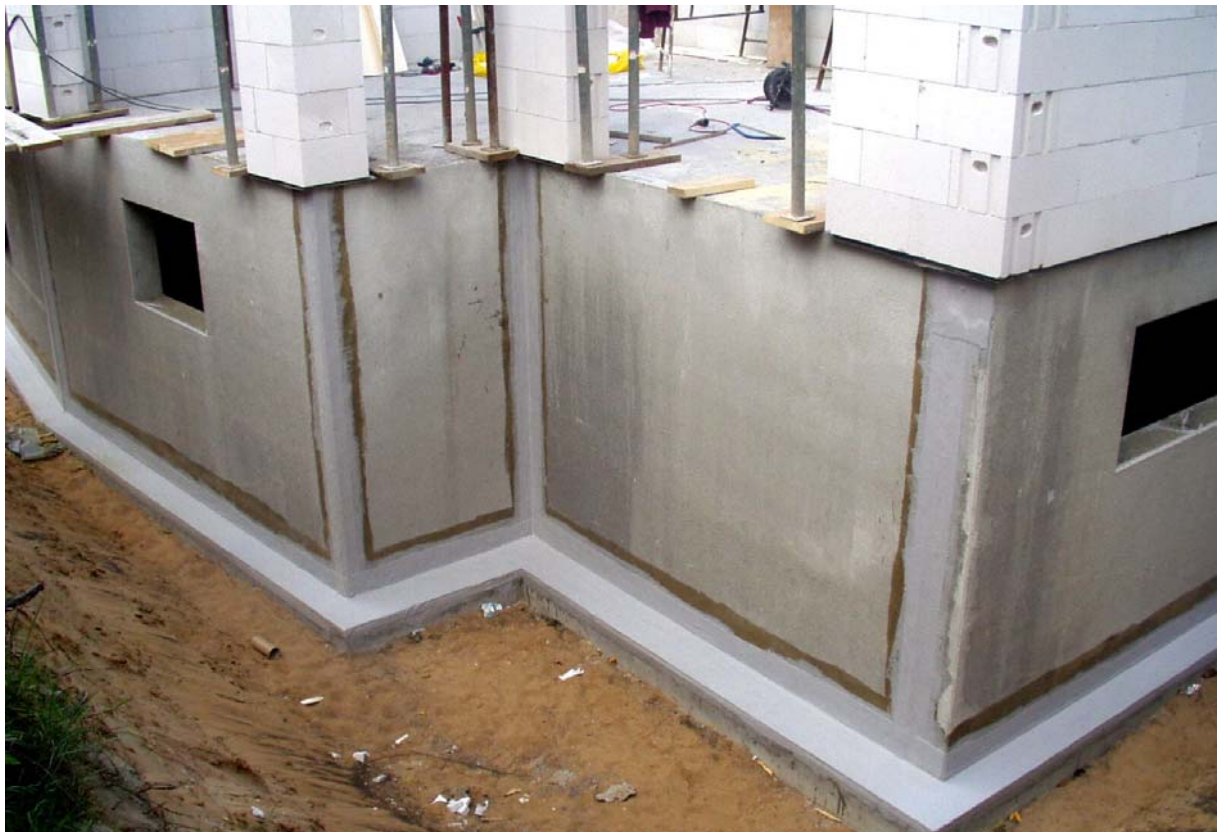
Foto 5: Streifenabdichtung von Element-Fertigteilwänden mit Flüssigkunststoff adicon® lamin DS

Wegen der Risikoproblematik innerhalb der Elementwände nutzen verschiedene Systemabdichter eine außenseitige Streifenabdichtung über Stoß- und Lagerfugen. Hierbei stehen bauaufsichtlich geprüfte Produkte auf Bitumenbasis bzw. hochwertige Flüssigkunststoffe zur Verfügung. Die Produkte auf Bitumenbasis können bis max + 5° C und einer Einbautiefe von 4 m eingesetzt werden; die Flüssigkunststoffe dagegen bis – 10° C und 20 m Wasserdruck. Die Unternehmen mit speziell ausgebildetem Fachpersonal erreichen diese Abdichtungsqualität durch intensive Untergrundvorbehandlung (z. B. Sandstrahlen) und durch Einlage einer hoch belastbaren Gewebeeinlage. Die Gewährleistungsübernahme auf die Dichtigkeit beträgt hierbei 5 bis 10 Jahre.